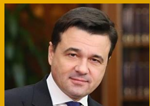
Андрей Воробьев Губернатор Московской Области